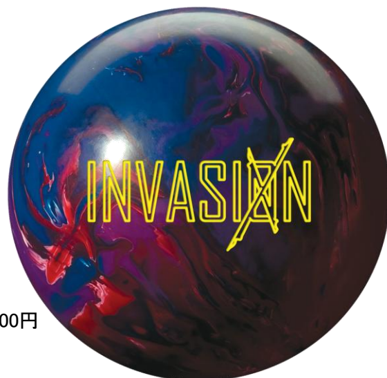
シンセティックレーン