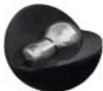
ミディアムコンディション