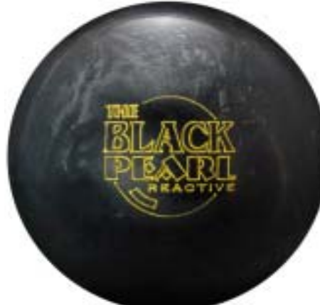
ブラックパール・リアクティブ

【仕様】 * 表面素材 TRACTION REACTIVE * 仕上げ POLISH RG:2.559 RG:.055