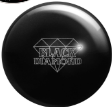
ブラック ダイヤモンド

【仕様】 * 表面素材 DIAMOND PARTICLE * 仕上げ HIGH POLISH RG:2.559 RG:.055