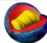
ミディアムHEAVYコンディション