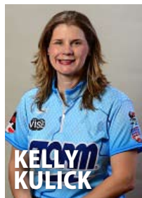
ケリー・キューリック