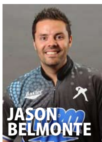
ジェイソン・ベルモンテ